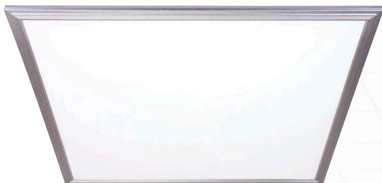
PPL PRO 6060*

Схема монтажа панели PPL PRO 6060 в стандартные подвесные потолки типа «Армстронг» и «Грильято»